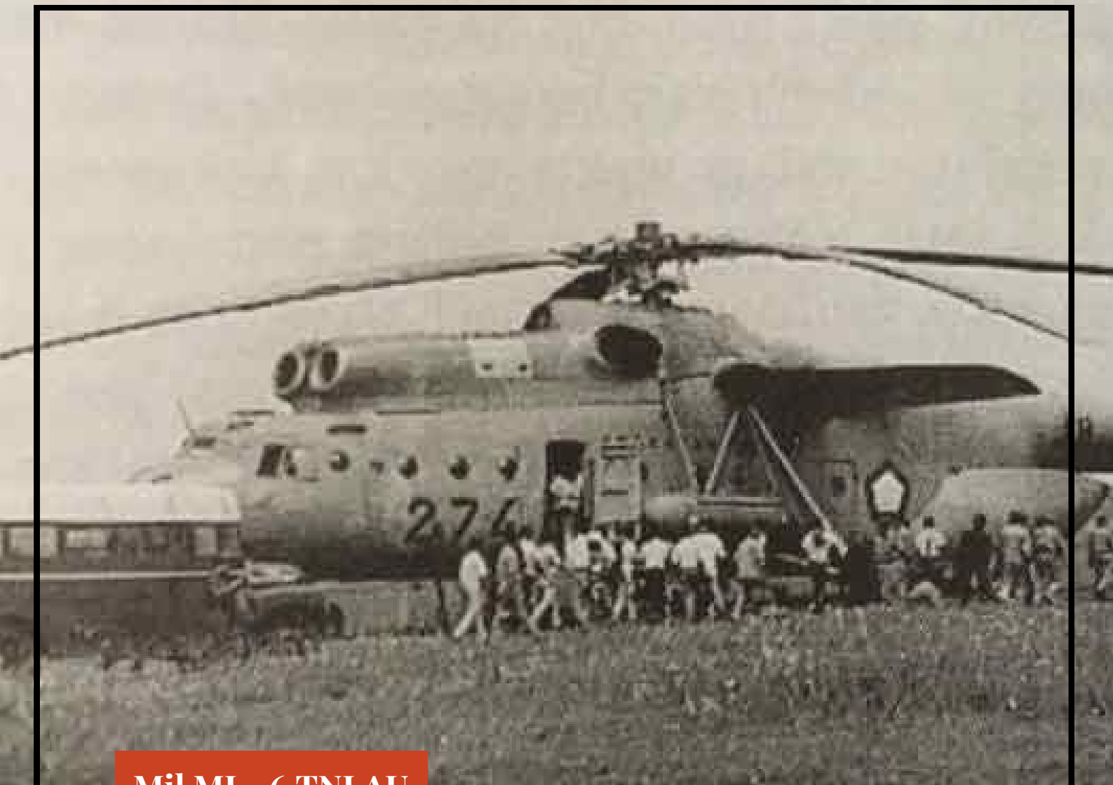
Mil MI - 6 TNI AU